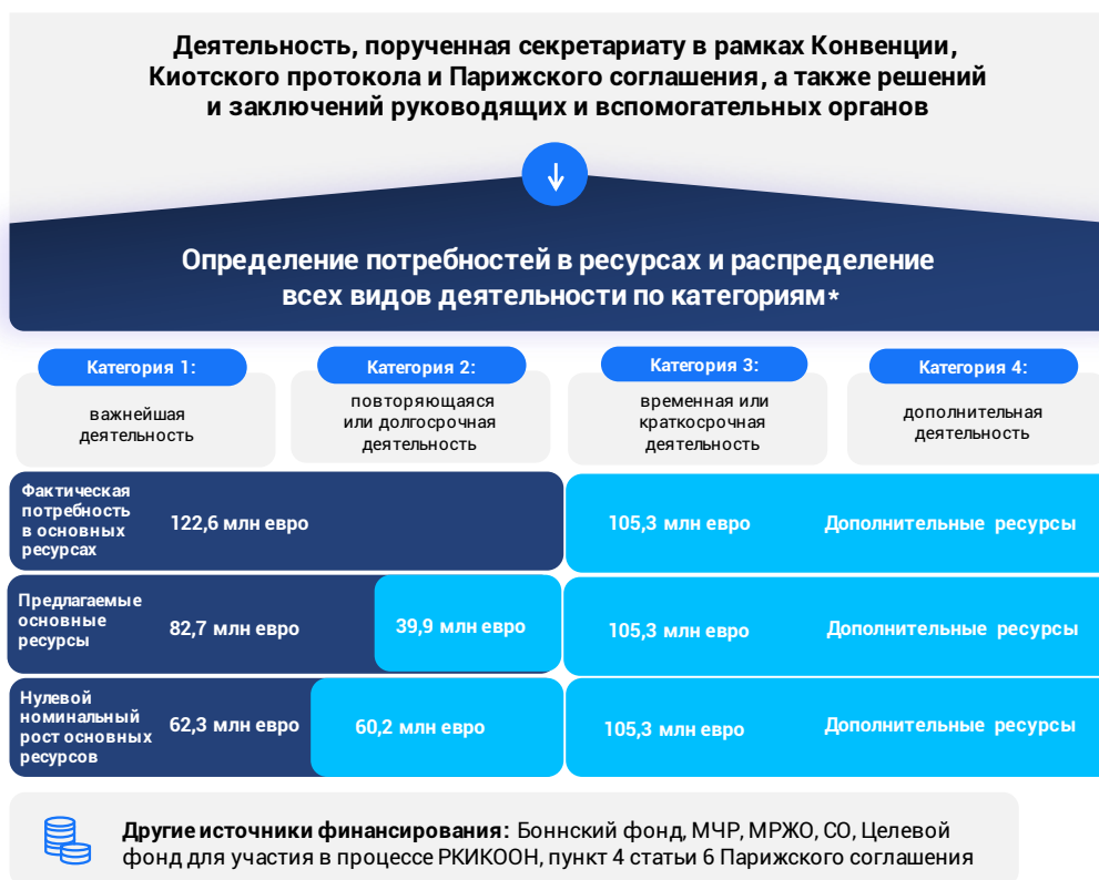
Рис. 3 Доля основных ресурсов на 2024–2025 годы при различных сценариях бюджета

* Примечание: Представленные бюджетные сметы не включают 7-процентную поправку на будущую инфляцию; из-за округления суммы цифр, представленных на рисунке, могут не совпадать с суммами в таблице 1.