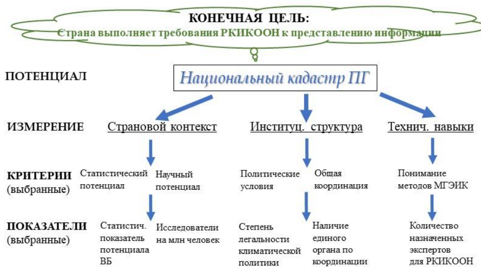
Рис. 2 Пример методики оценки прогресса в укреплении потенциала

Источник: Umemiya C and White MK. 2020. Global Database of National GHG Inventory (GHGI) Capacity in Developing Countries. URL: https://www.un-gsp.org/global-database-national-ghg-inventory-ghgi-capacity-developing-countries .