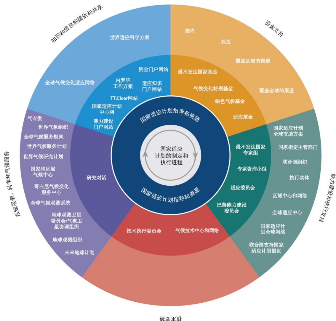
图 2 关于为制定和执行国家适应计划进程提供支持情况的入口门户

69. 适应委员会第 20 次会议注意到迄今取得的进展，请秘书处进一步开发在线资源，同时考虑到从适应委员会第 20 次会议收到的指导意见和国家适应计划工作组今后的任何指导意见。它商定印刷版本也将是有用的，这两个产品都应定期更新。