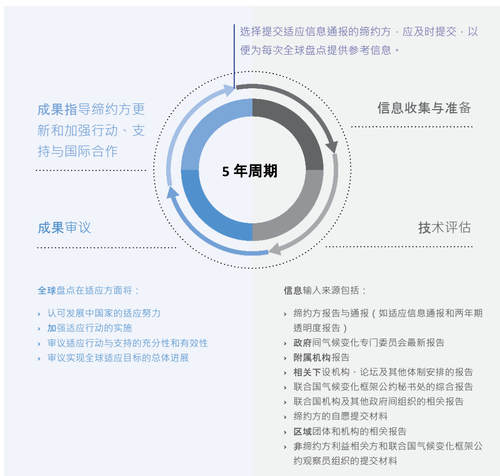
图 1 适应信息通报在全球盘点中的作用

报的缔约方及时提交，以便为每次盘点提供信息 8 ；同时进一步鼓励缔约方尽快提交首次适应信息通报，为首次全球盘点提供及时输入。 9