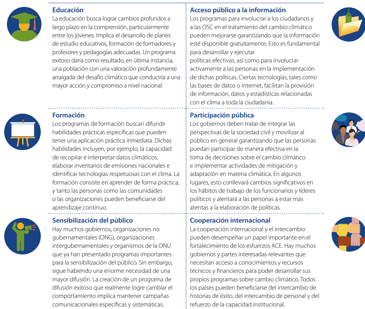
Tabla 2 • Características de cada elemento ACE