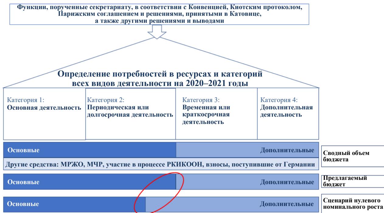
Рис. 3 Обзор бюджета