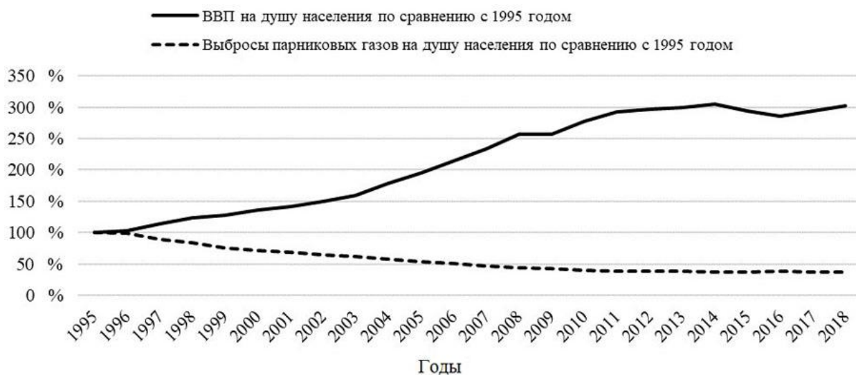
Рисунок 3. Динамика выбросов парниковых газов и ВВП в 1995 - 2018 годах

Среднегодовой прирост ВВП за 1995 - 2018 годы составил 4,9 процента, а среднегодовой прирост выбросов парниковых газов за этот же период - 0,5 процента. Благодаря целенаправленной политике государства в области энергосбережения и повышения энергоэффективности производства углеродоемкость экономики за 1995 - 2018 годы снизилась почти в три раза (рисунок 3).