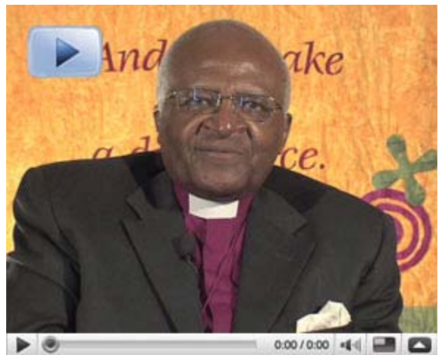
VIDEOMENSAJE DEL ARZOBISPO DESMOND TUTU PARA LA CP 15