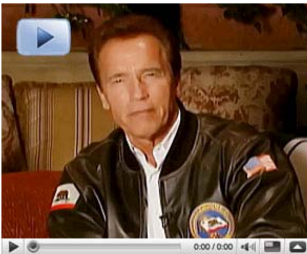
VIDEOMENSAJE DE ARNOLD SCHWARZENEGGER, GOBERNADOR DE CALIFORNIA,