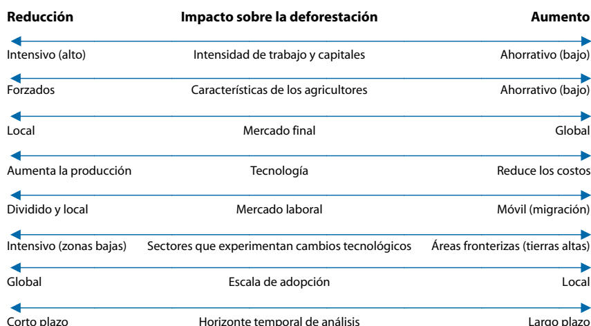
Figura 2. Relaciones entre tecnologías agrarias y deforestación