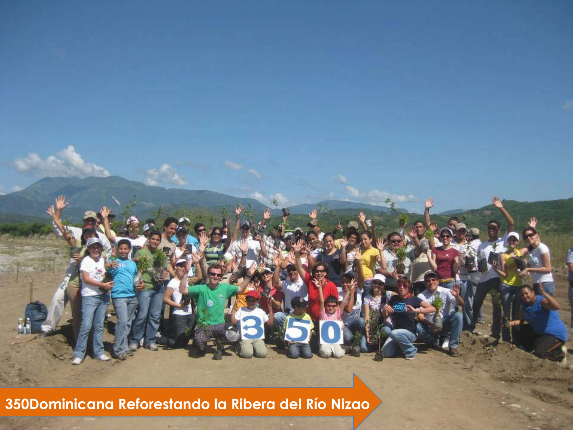
350Dominicana Reforestando la Ribera del Río Nizao