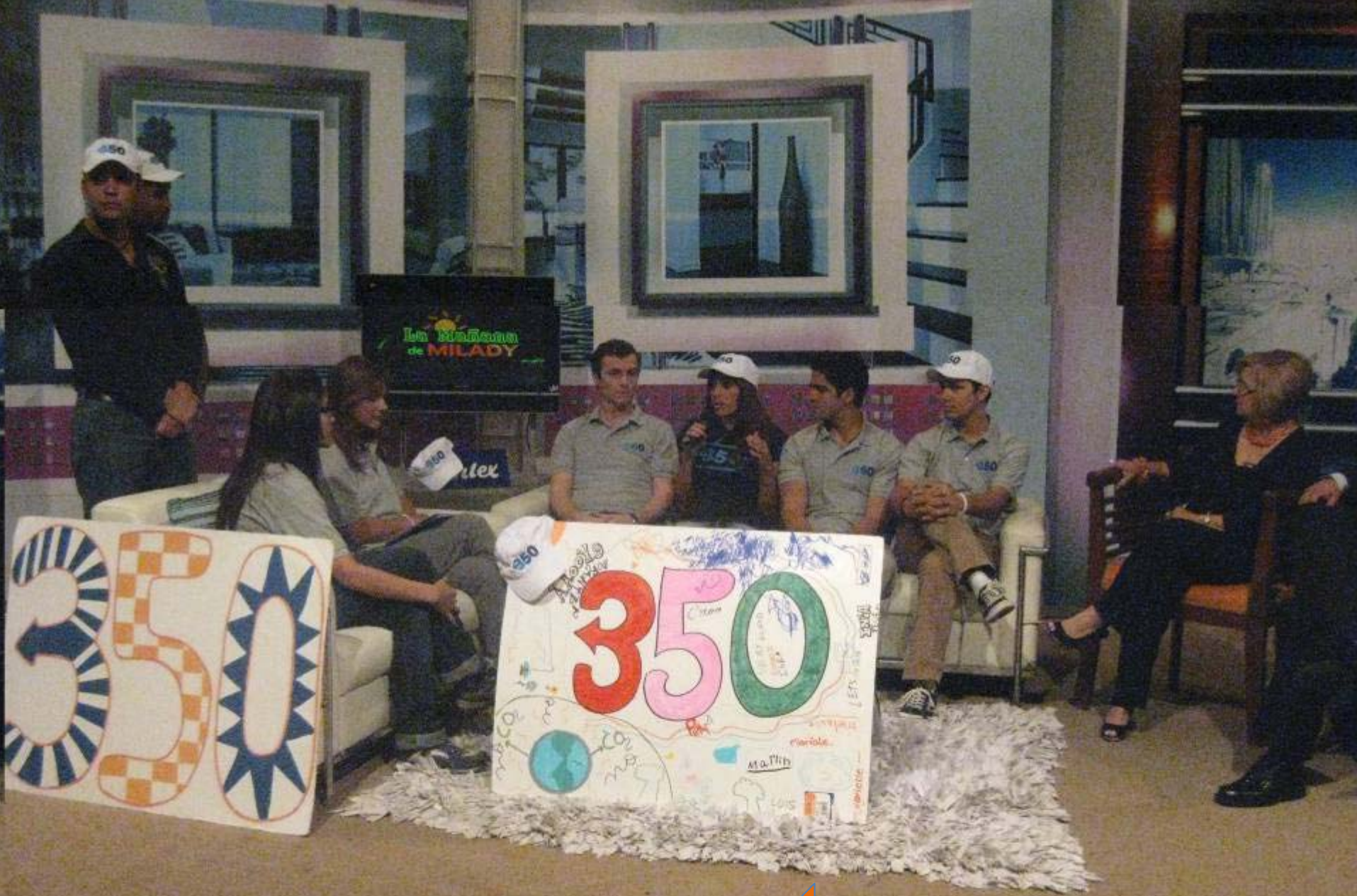
Presencia en Programas de TV