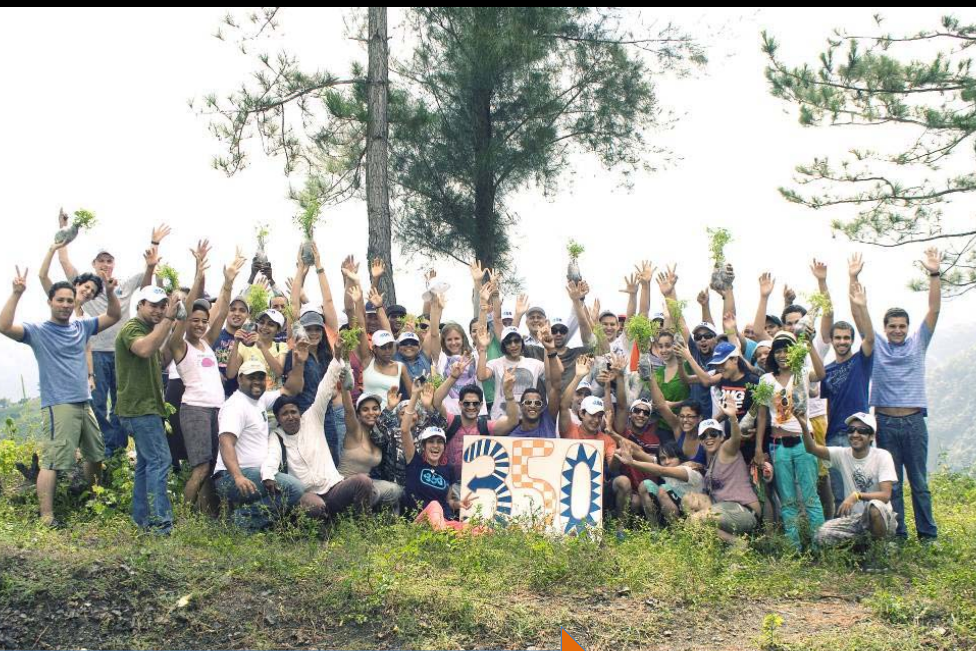
350Dominicana Reforestando en San Cristóbal