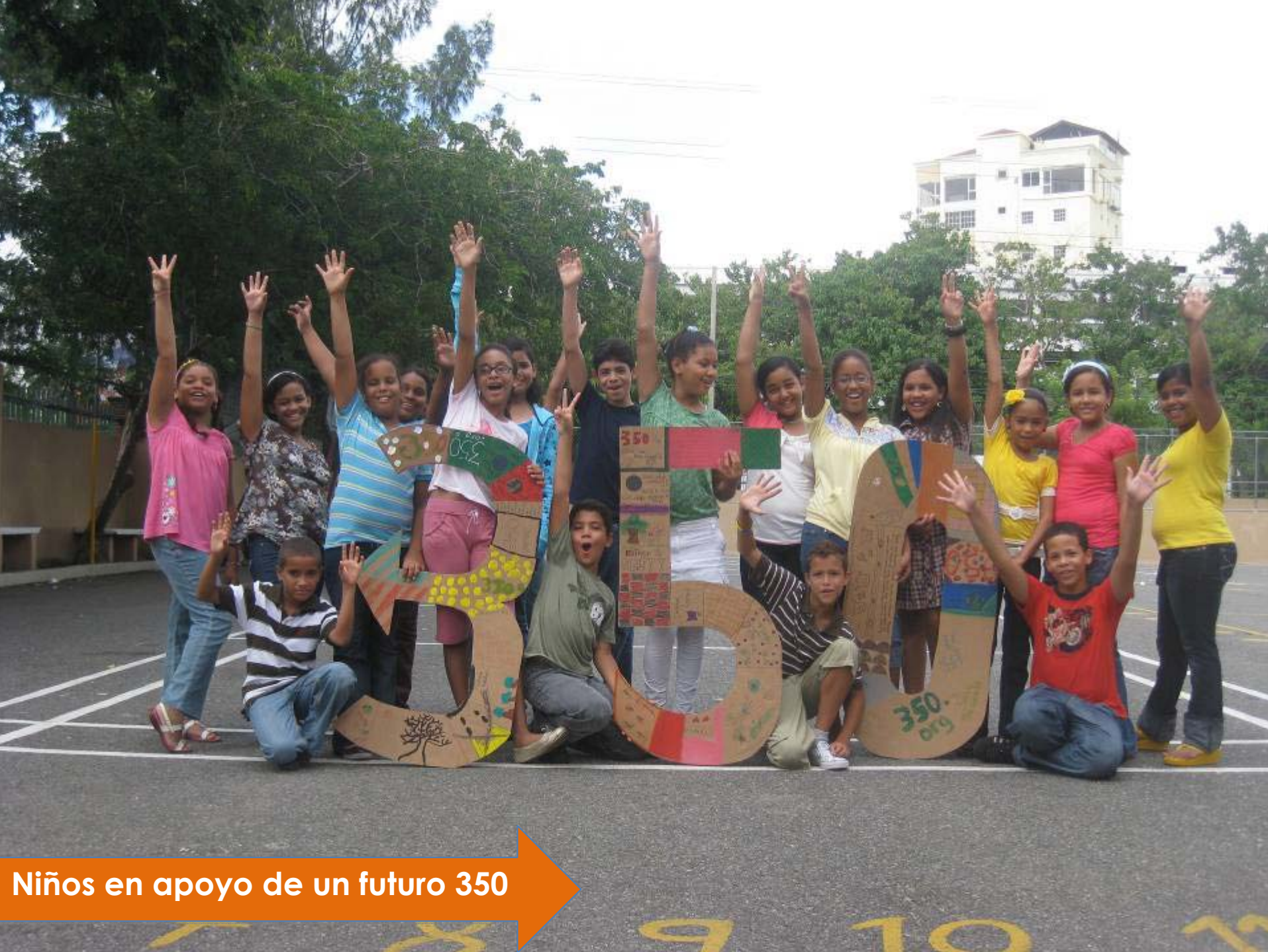
Niños en apoyo de un futuro 350