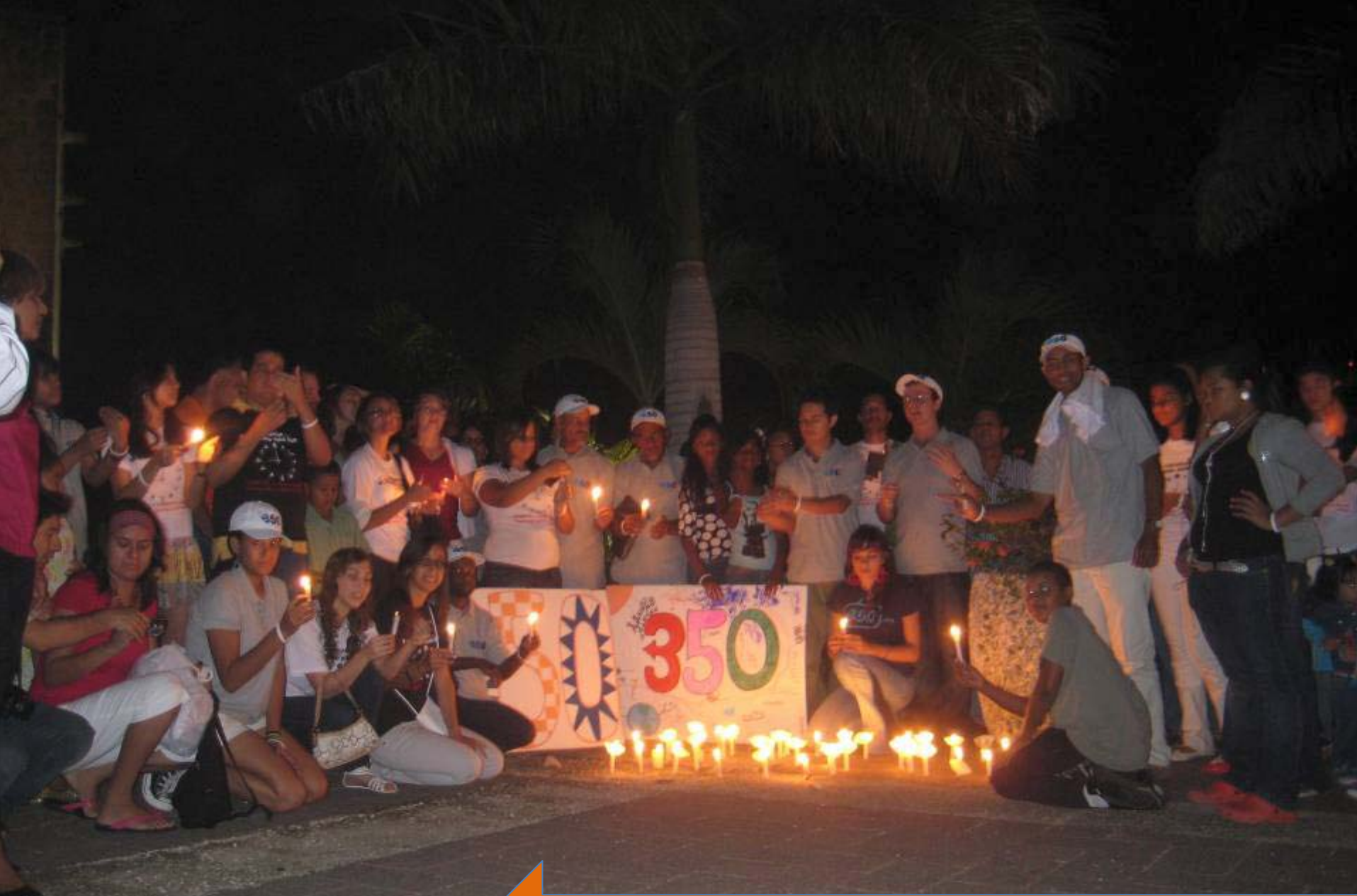
Vigilia de Supervivencia – Diciembre 12, 2009.