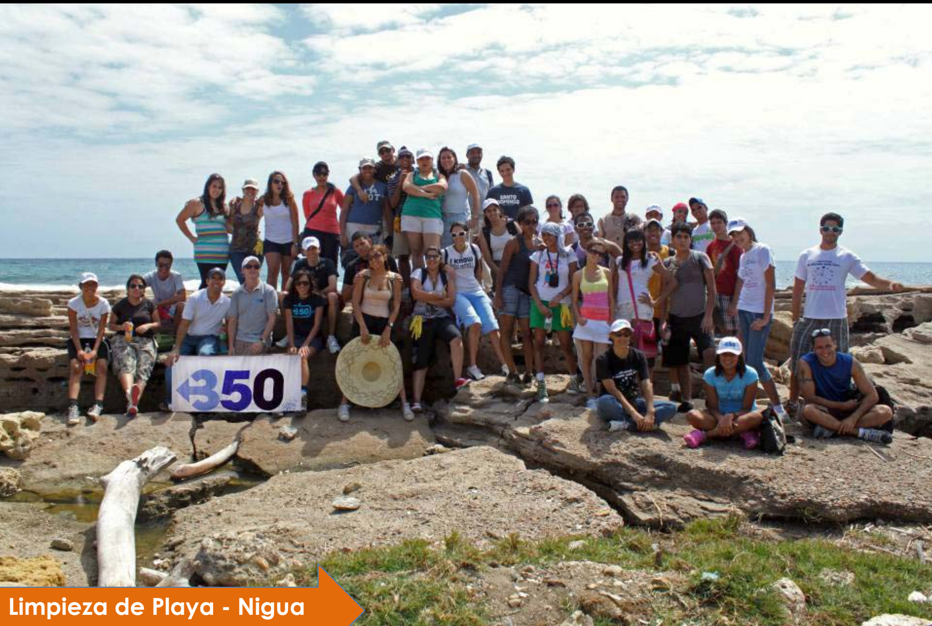
Limpieza de Playa - Nigua