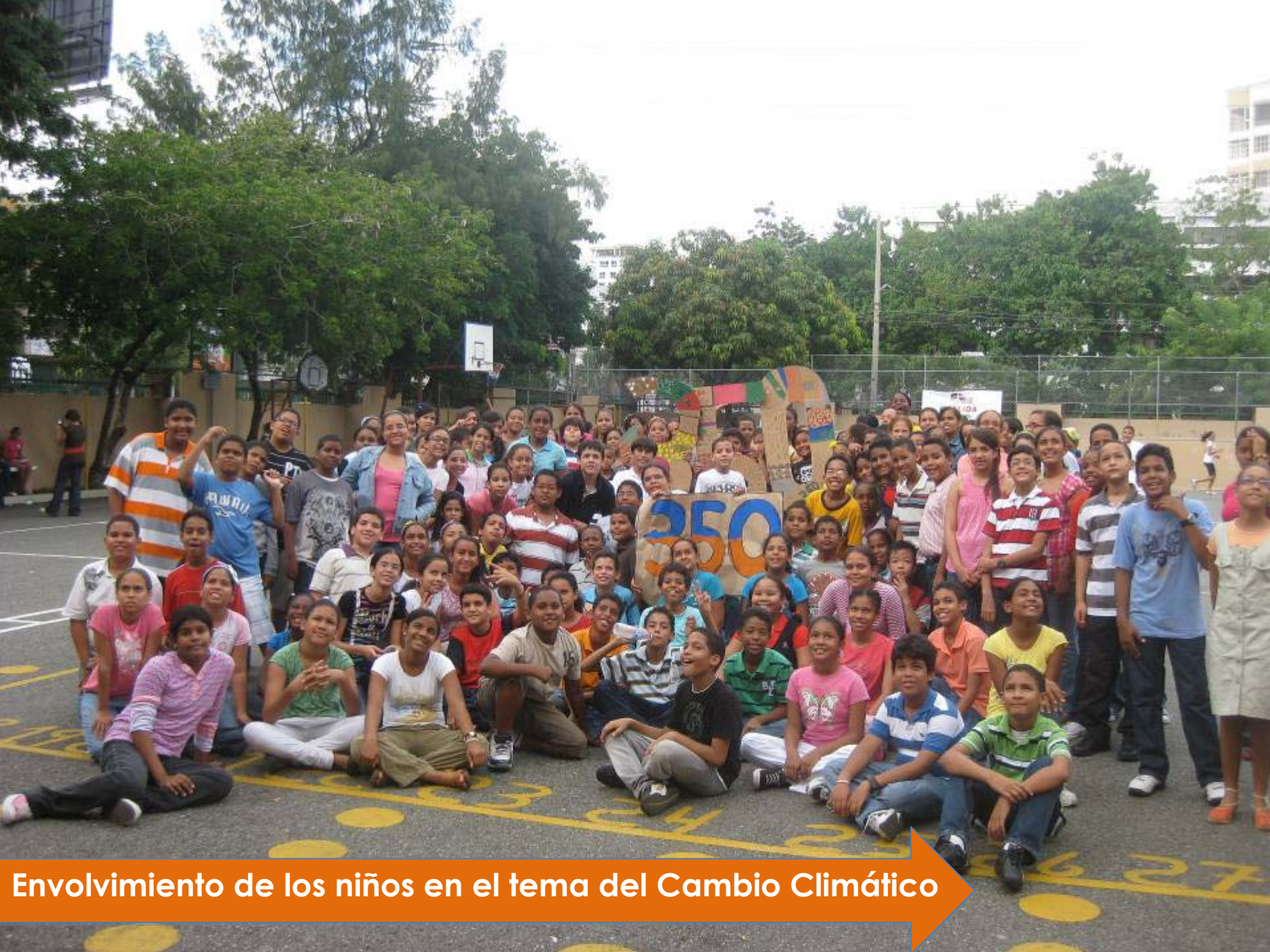
Envolvimiento de los niños en el tema del Cambio Climático